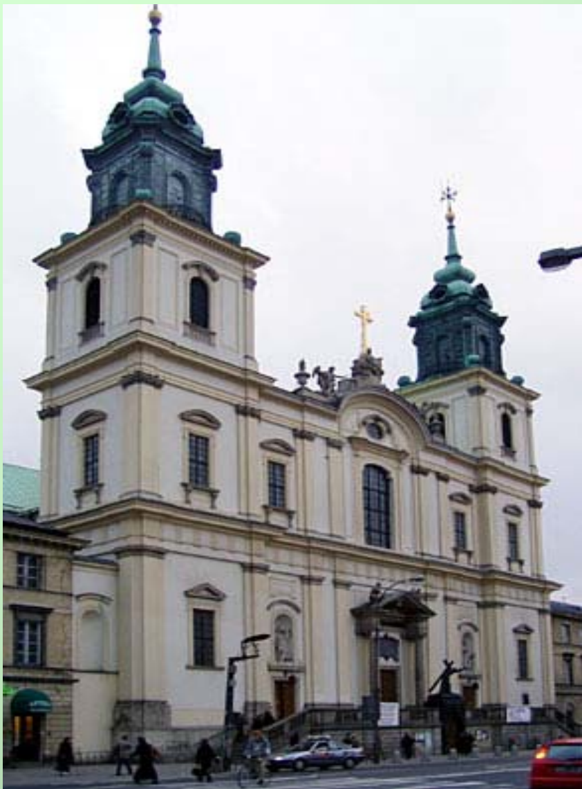
Bazylika św. Krzyża w Warszawie