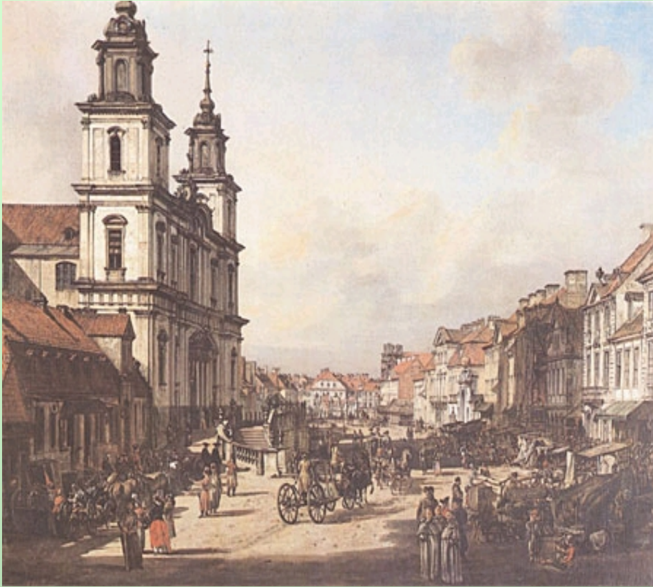
Canaletto, Krakowskie Przedmieście