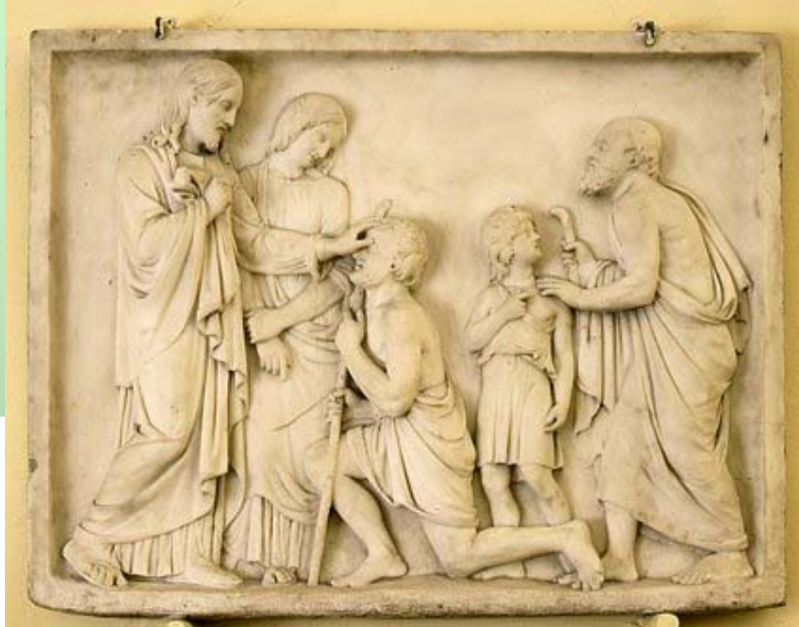
Chrystus uzdrawiający niewidomych