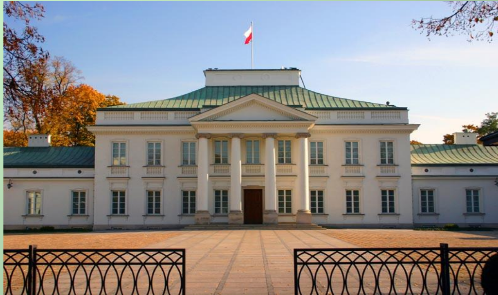
Belweder w Warszawie