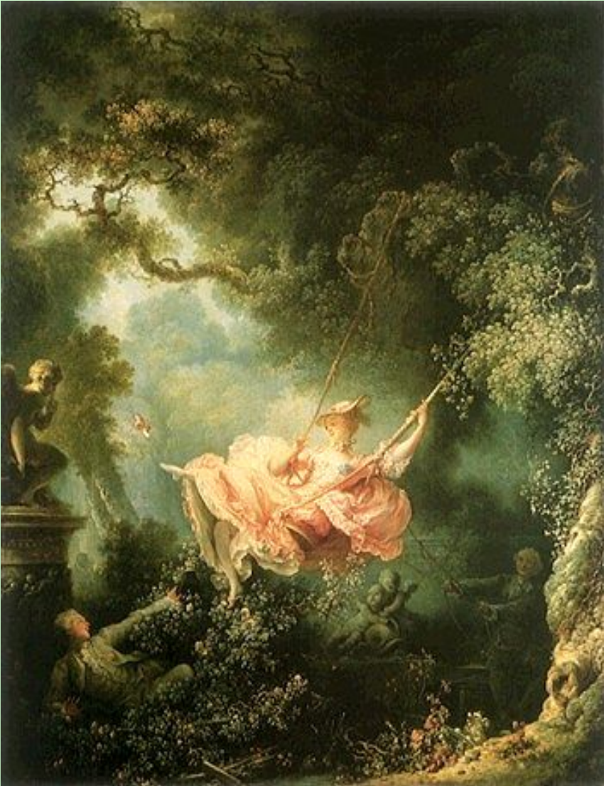
Jean Fragonard, Huśtawka