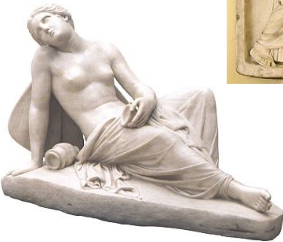
Psyche umierająca Jakub Tatarkiewicz