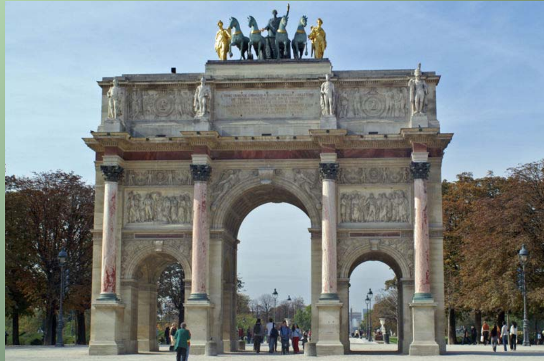
Łuk triumfalny w Paryżu