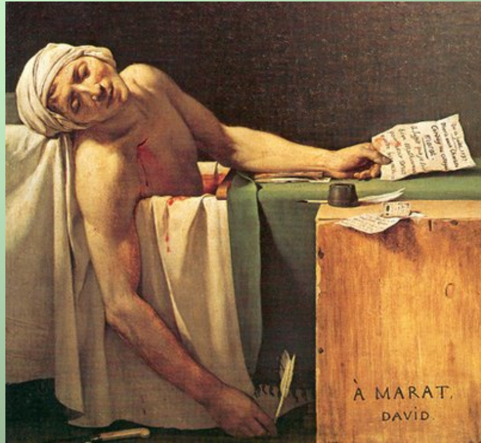
Jacques David, Śmierć Marata