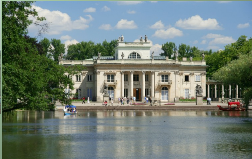
Pałac na wodzie, Łazienki