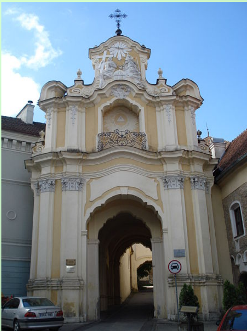
Wilno, Ostra Brama