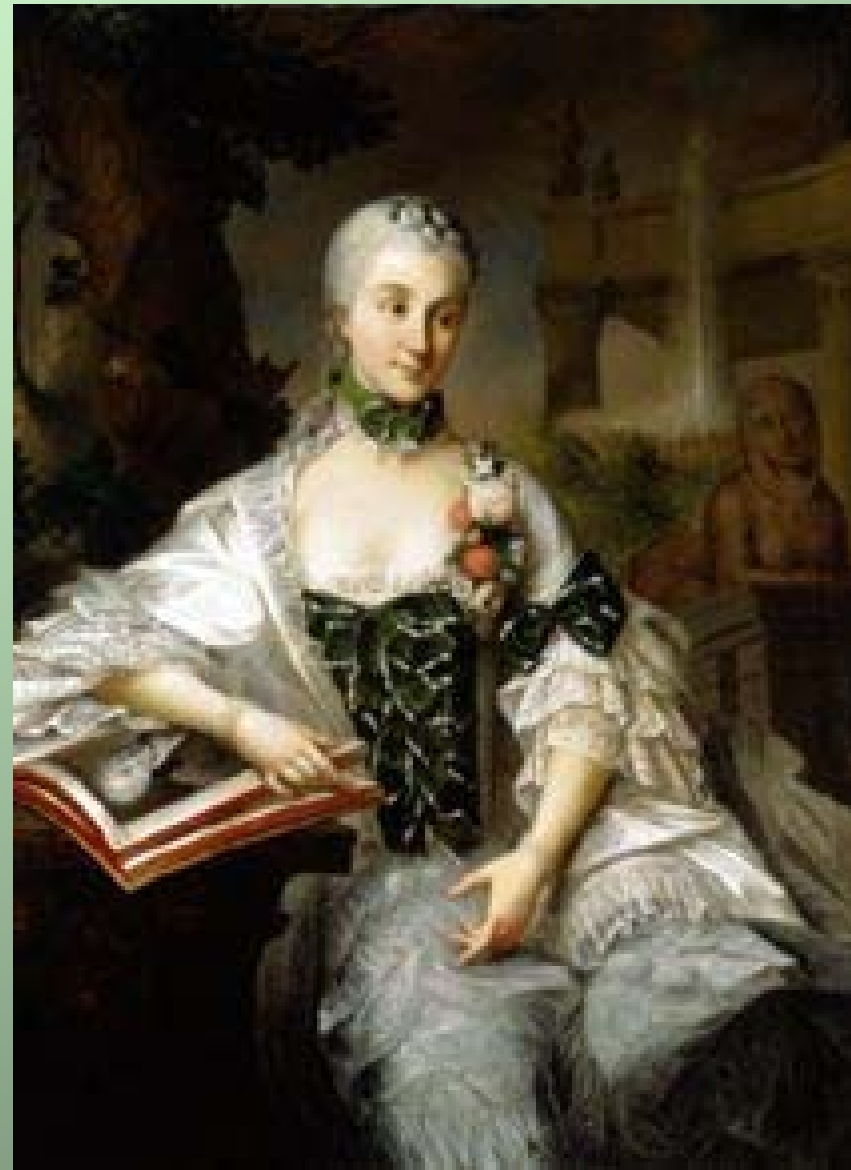
Marcello Bacciarelli, Izabella Poniatowska Branicka