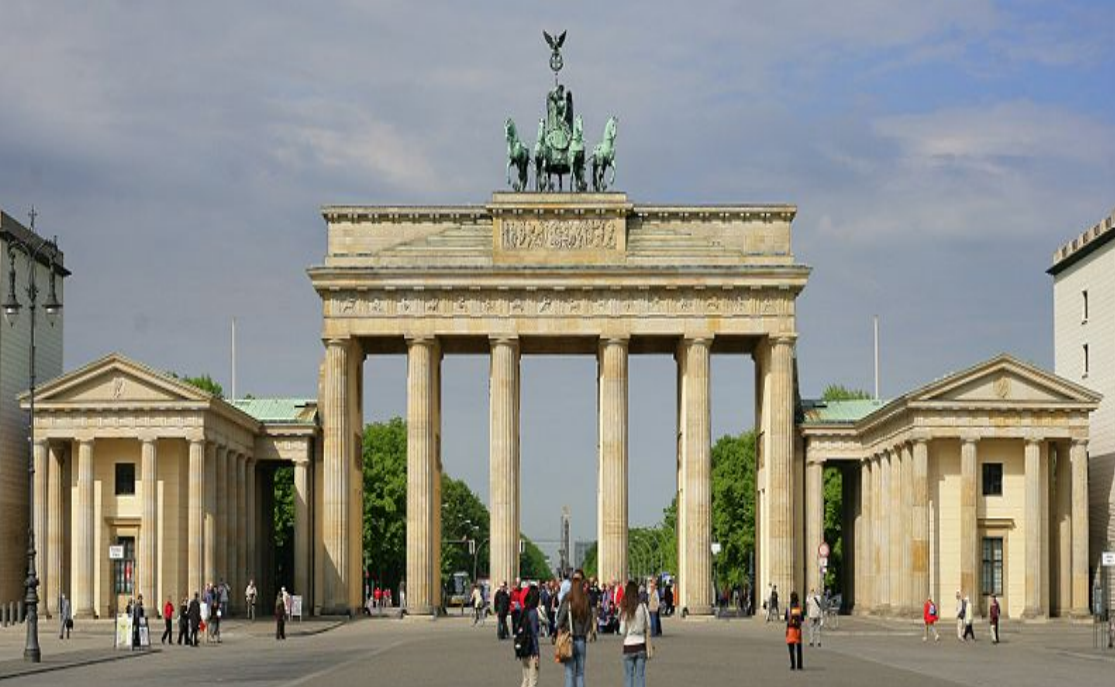
Brama Brandenburska, Berlin