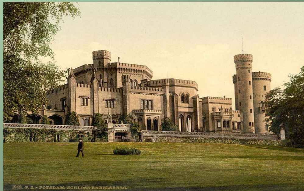
Zamek Babelsberg, Niemcy